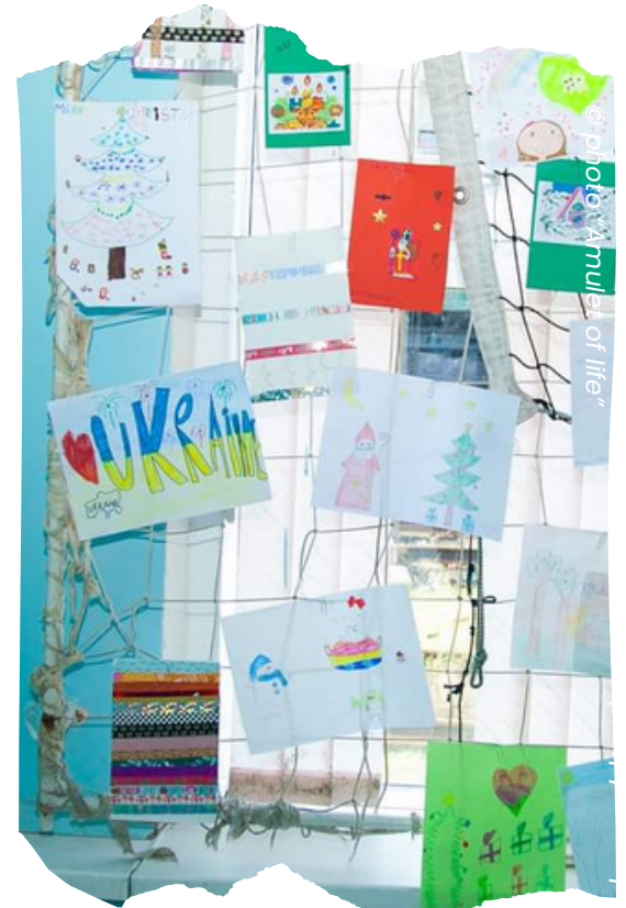
Affichage des dessins des enfants français !

AMULET OF LIFE a ensuite organisé un concours de dessins en réponse aux nombreux dessins envoyés par les enfants français. : "Le concours de dessin a donné aux enfants de grandes émotions de beaucoup de sourires . Après de longues discussions, la commission a été heureuse d'annoncer les gagnants. Cependant, il convient de noter que tous les participants au concours sont de vrais gagnants car chaque dessin était spécial et unique ! Tous les participants ont reçu des bonbons d'enfants français et ont eu l'occasion de remercier leurs nouveaux amis français en soumettant leurs dessins. C'est devenu une réponse miroir à la chaleur et à l'humeur joyeuse que nous ressentons de nos amis français ! (Andrei, animateur d'Amulet Of Life)