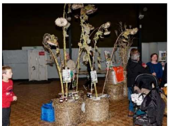
Association des Semeurs et Planteurs

Echanges d'expériences concrètes (atelier de cuisine 1 , atelier de découverte de graines 2 , atelier de fabrication d'oyas 3 ), expositions photos d'ici et d'ailleurs, jeux collectifs de sensibilisation à la solidarité (CCFD), spectacle musical et témoignages prouvent encore que chacun fait sa part pour faire advenir un monde où il fait bon cultiver le vivre ensemble. Ce monde désirable a été promu au cours des deux semaines du FESTISOL par la projection de films documentaires, ensuite animés de débats, et spectacles à thème.