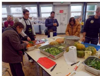
Atelier cuisine Solibio

L'édition 2023 du Festival des Solidarités (Festisol) a été d'une richesse remarquable. Le dimanche 12 novembre, à la salle des fêtes de Mainvilliers, une vingtaine d'associations ont partagé leur cœur d'engagement et leurs talents respectifs. Les acteurs des associations et les visiteurs ont participé à un grand atelier de cuisine, animé par l'équipe traiteur de l'association de réinsertion professionnelle SOLIBIO de Champhol et approvisionné en légumes bio cultivés par l'association à Voves.