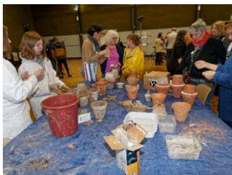
Atelier oyas, Lycée Franz Stock

L'édition 2023 du Festival des Solidarités (Festisol) a été d'une richesse remarquable. Le dimanche 12 novembre, à la salle des fêtes de Mainvilliers, une vingtaine d'associations ont partagé leur cœur d'engagement et leurs talents respectifs. Les acteurs des associations et les visiteurs ont participé à un grand atelier de cuisine, animé par l'équipe traiteur de l'association de réinsertion professionnelle SOLIBIO de Champhol et approvisionné en légumes bio cultivés par l'association à Voves.