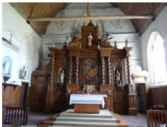
église de Vitray-en-Beauce

Cette année, pour des raisons sanitaires un car ne sera pas affrété et les adhérents de l'association rejoindront directement le premier point de visite, après inscription préalable et sur présentation du pass sanitaire.